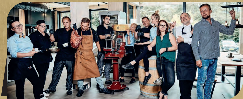
Kolektív reštaurácie PINUS.

Nech sa páči, vyberte si z ponuky našich jedál. Veríme, že Vám bude chutiť.